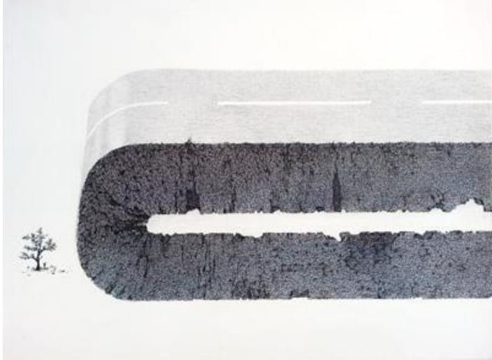
3. Min Jung-Yeon | La raison de détourner | encre de chine et crayon de couleur sur papier | 21 x 28 cm | 2018

La lettre de Pluton dessin - peinture 6. 03. - 28. 04. 2018