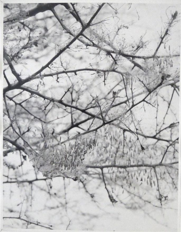
1. Nicolai Howalt | Night weave 3 | photo analogue sur papier vintage | 35 x 28 cm | 2017