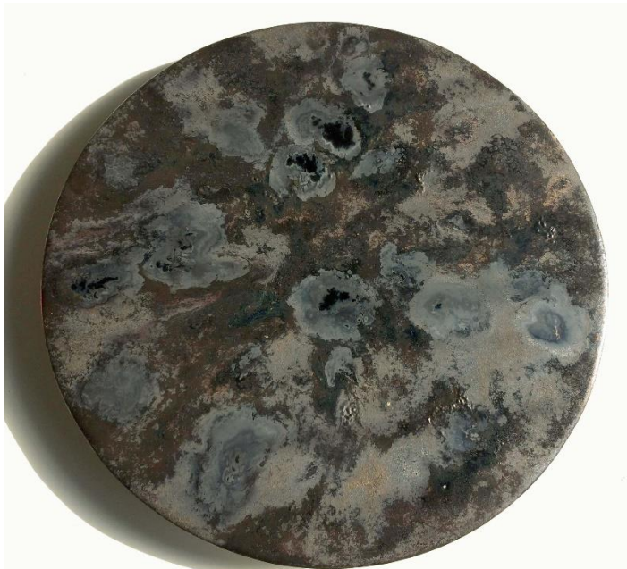
2. Linda Swanson | Black Hole II | porcelaine et glaçure | diam. 50 cm | 2017

Installations, expérimentations et sculptures - dans son ensemble, l'œuvre de la plasticienne américaine Linda Swanson tend à mettre en avant les qualités inhérentes de la matière céramique pour éveiller les sens et le potentiel illimité de la perception humaine. Elle cherche à stimuler la compréhension d'un monde en transformation permanente et suggère de nouveaux angles de vue afin d'attirer notre attention sur les modèles et systèmes d'interprétation dont l'immense richesse marque l'histoire de l'humanité. Avec le titre Phasis Linda Swanson a souhaité faire référence non seulement aux phases, à l'état des matières - des cycles et du temps - mais également à la signification en grec ancien, à savoir l'idée d'une apparition.