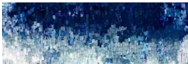
Lyndi Sales | The person that you see physically is just the tip of the iceberg (détail) | 330 x 330 cm vlieseline teinte en indigo, colle, fils | 2014

Le titre du projet est une citation du violoncelliste Yo-Yo Ma ; il reflète l'intérêt de l'artiste pour l'invisible, pour les systèmes et les forces qui sous-tendent notre monde.