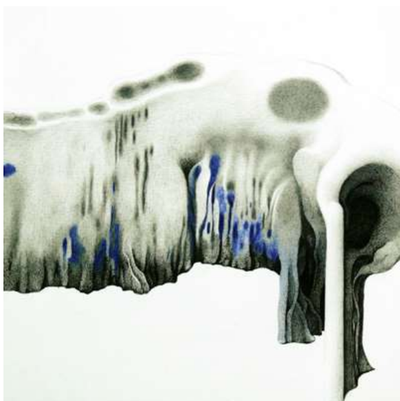
Min Jung-Yeon | La falaise de la paresse | 19,8 x 20 cm | aquarelle, crayon de couleur et encre de Chine sur papier | 2014