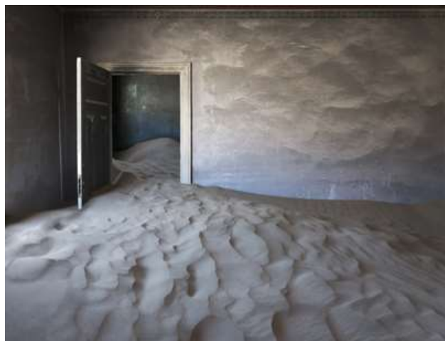
Helene Schmitz | The Blue Room | 98 x 128 cm | digigraphie | 2015

www.dunkerskulturhus.se/utstallning/platshallare-utstallning/borderlands/