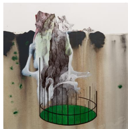
3. MIN Jung-Yeon | Monter un théâtre | 29 x 24 cm | encre de Chine, crayon de couleur et acrylique sur papier | 2016