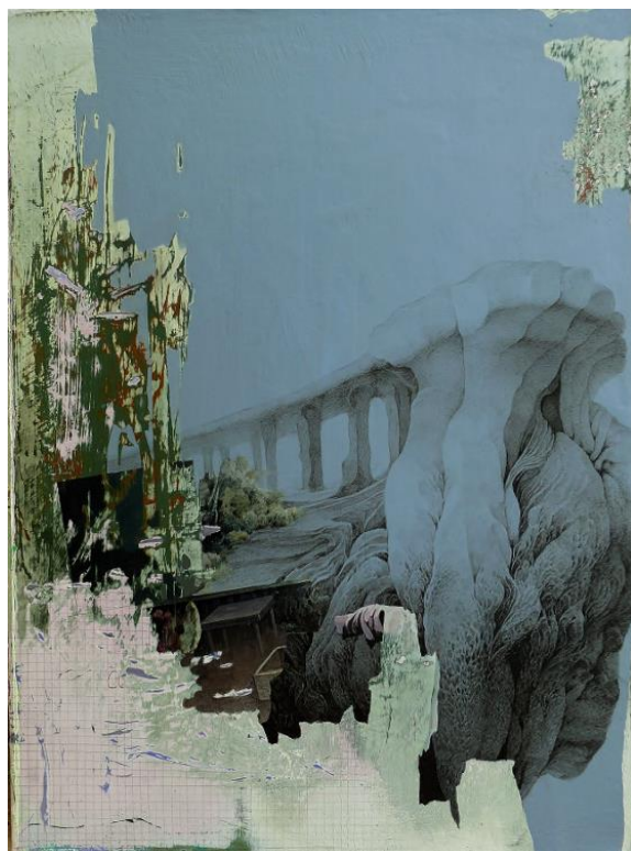
MIN JUNG-YEON | Lumière de 17h | 40 x 30 cm | acrylique sur toile | 2017