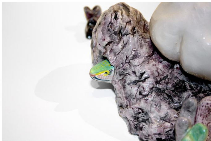
SHOI | Notre première rencontre | 13 x 31 x 19 cm | faïence et glaçure | 2017

Panorama d'une mythologie personnelle, les œuvres de Shoi - qu'il s'agisse de sculptures en céramique, de dessins ou de performances - servent à revivre, à exorciser et à dépasser un vécu, une difficulté, dans l'esprit d'un rite de passage chamanique. La maternité et les sentiments complexes et contradictoire qu'elle inspire y tient une place importante.